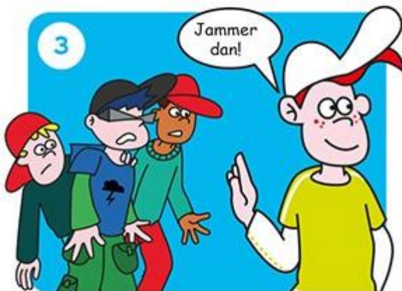
Ga iets anders doen.