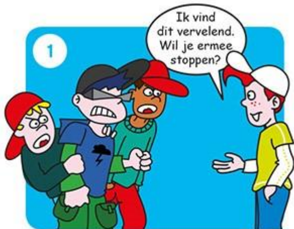
Zeg dat je het niet leuk vindt.