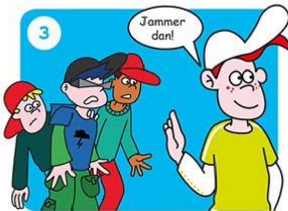
Ga iets anders doen.