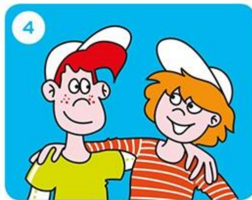
Stap naar je maatje of jouw maatje stapt naar jou.