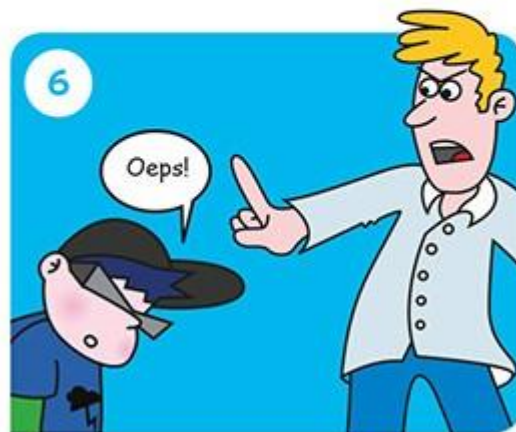
Ga naar je juf of meester. Die grijpt in.