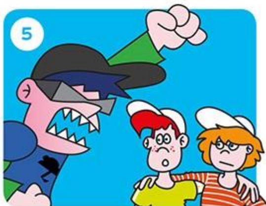
Gaat het door?