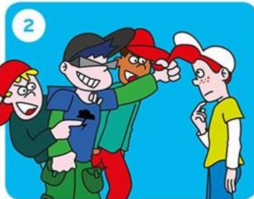
Gaat het door?